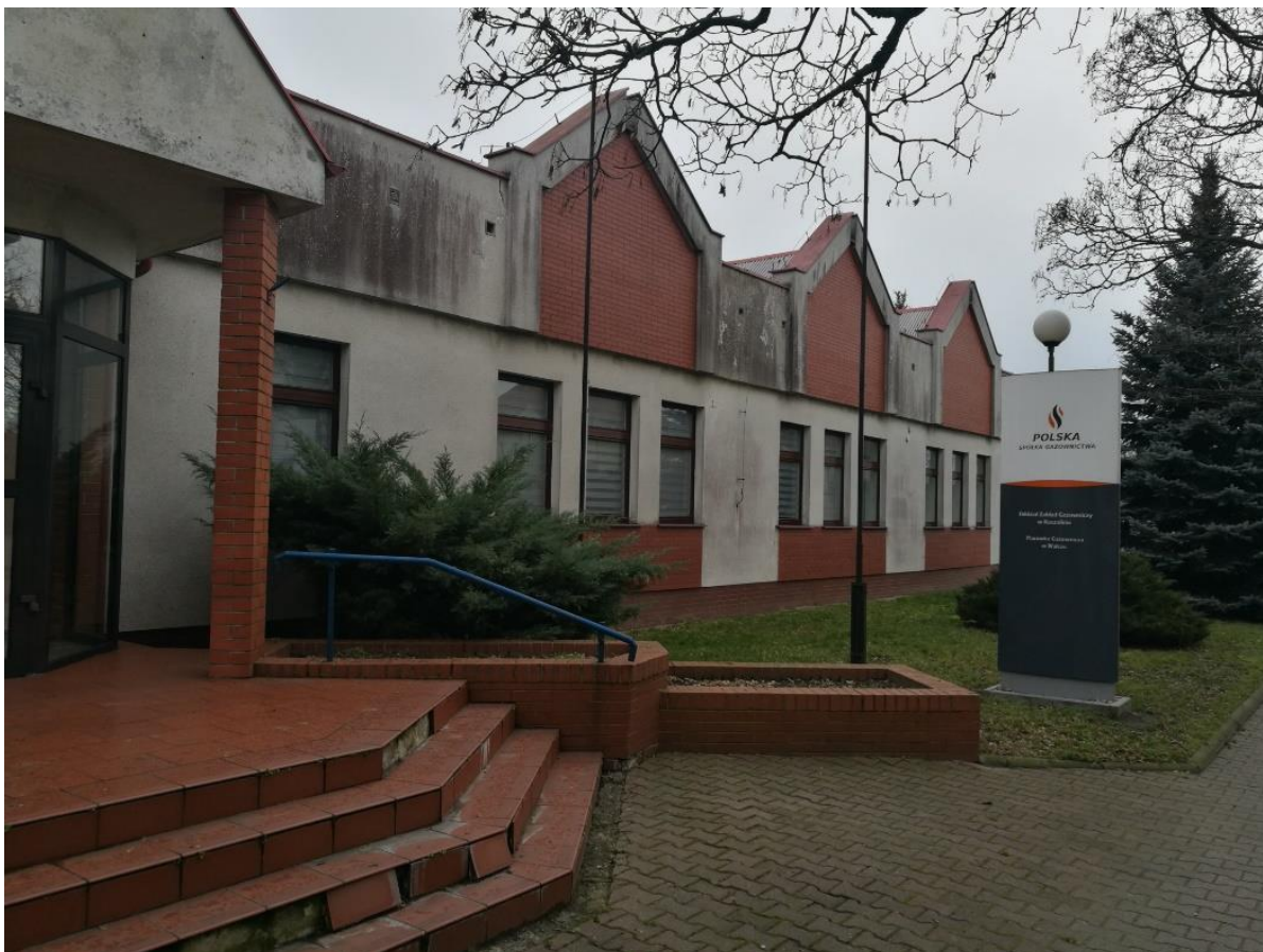
Wejście główne od strony ul. Parkowej